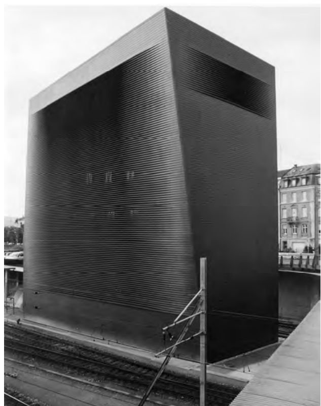
Karl Moser's Pauluskirche (1901), Herzog & de Meuron's Zentralstellwerk (1999), Michael Alder's Stadion Rankhof (1995) und Diener & Diener's Wohnhäuser „St. Albantal“ (1986; von oben nach unten, von links nach rechts)..