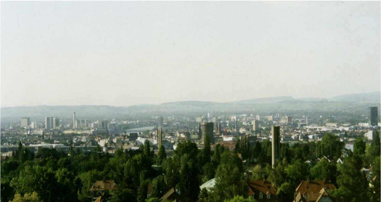
Basel im Blick aus Südost (oben). Fassade des Gebäudes „Forum 3“ von Diener & Diener auf dem Novartis Campus (2002-2005).